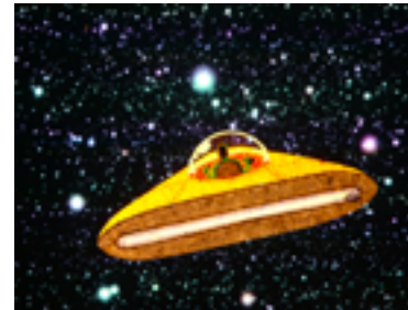
https://sceneweb.fr/wp-content/uploads/2019/10/stellaire-dessin-steroptik.jpg dessin STEREOPTIK

31 octobre 2019 / dans À la une, A voir, Angers, Bourges, Cherbourg, Douai, Evry, Genève, Les critiques, Paris, Théâtre / par Stéphane Capron